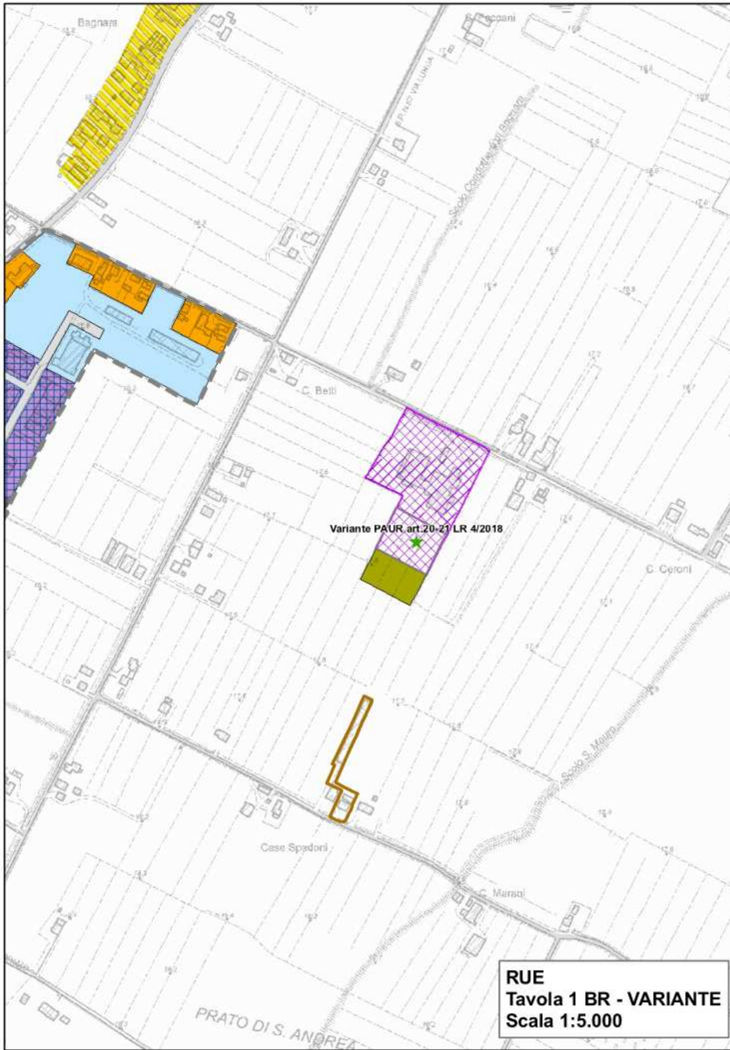
RUE Tavola 1 BR - VARIANTE Scala 1:5.000