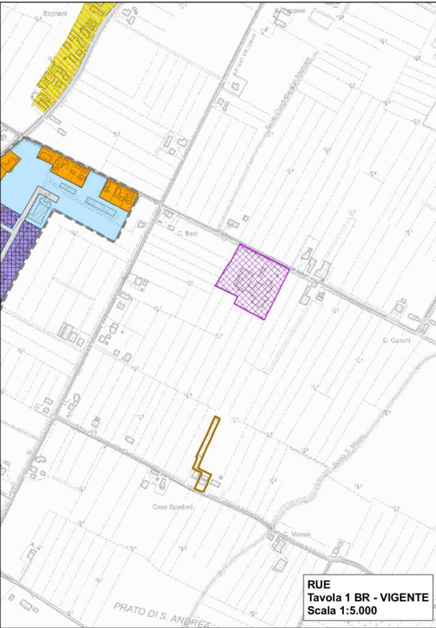
RUE Tavola 1 BR - VIGENTE Scala 1:5.000